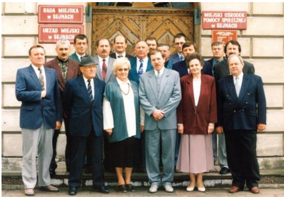
Rada Miasta Sejny, kadencja 1994-1998