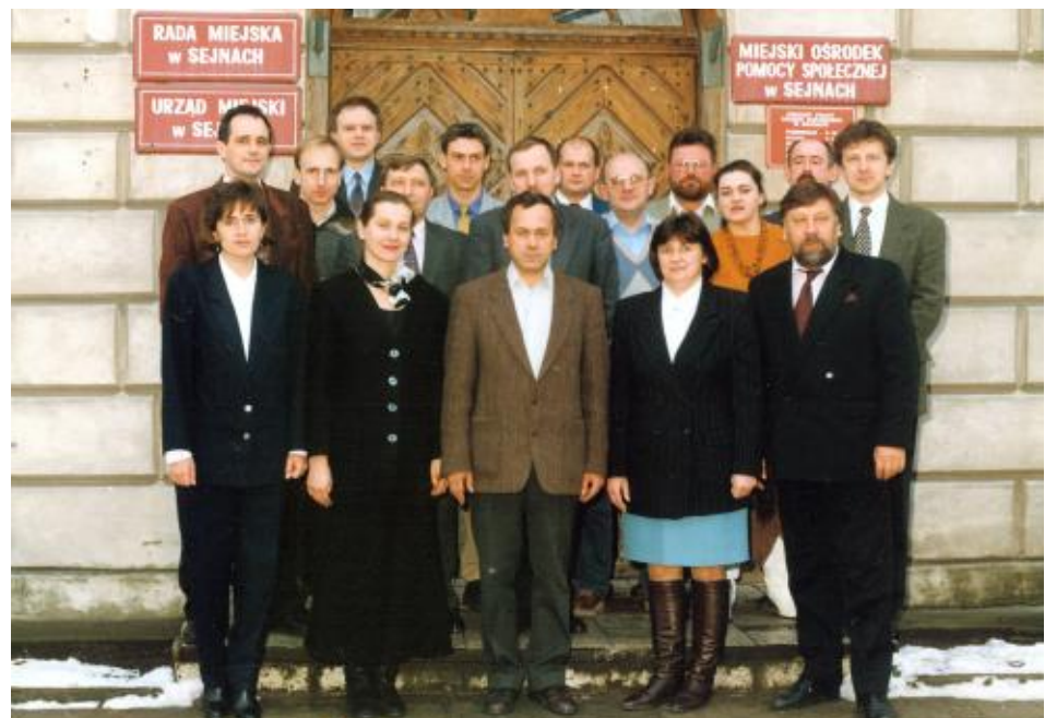
Rada Miasta Sejny, kadencja 1998-2002