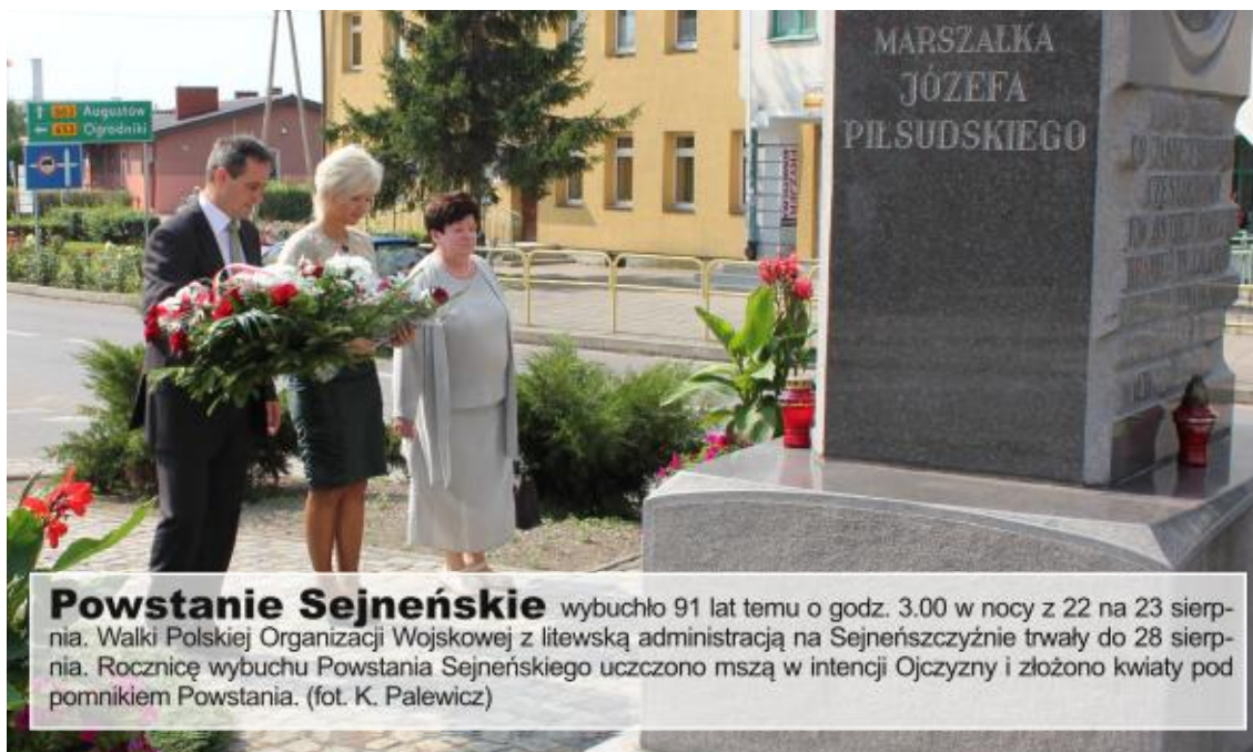
Powstanie Sejneńskie wybuchło 91 lat temu o godz. 3.00 w nocy z 22 na 23 sierpnia. Walki Polskiej Organizacji Wojskowej z litewską administracją na Sejneńszczyźnie trwały do 28 sierpnia. Rocznicę wybuchu Powstania Sejneńskiego uczczono mszą w intencji Ojczyzny i złożono kwiaty pod pomnikiem Powstania.