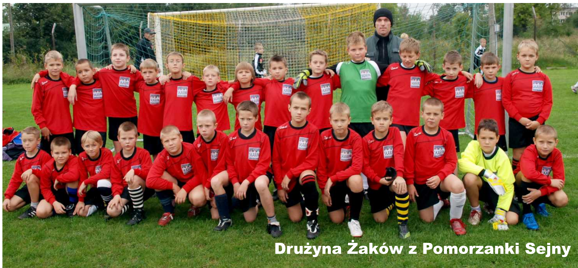
Drużyna Żaków z Pomorzanki Sejny