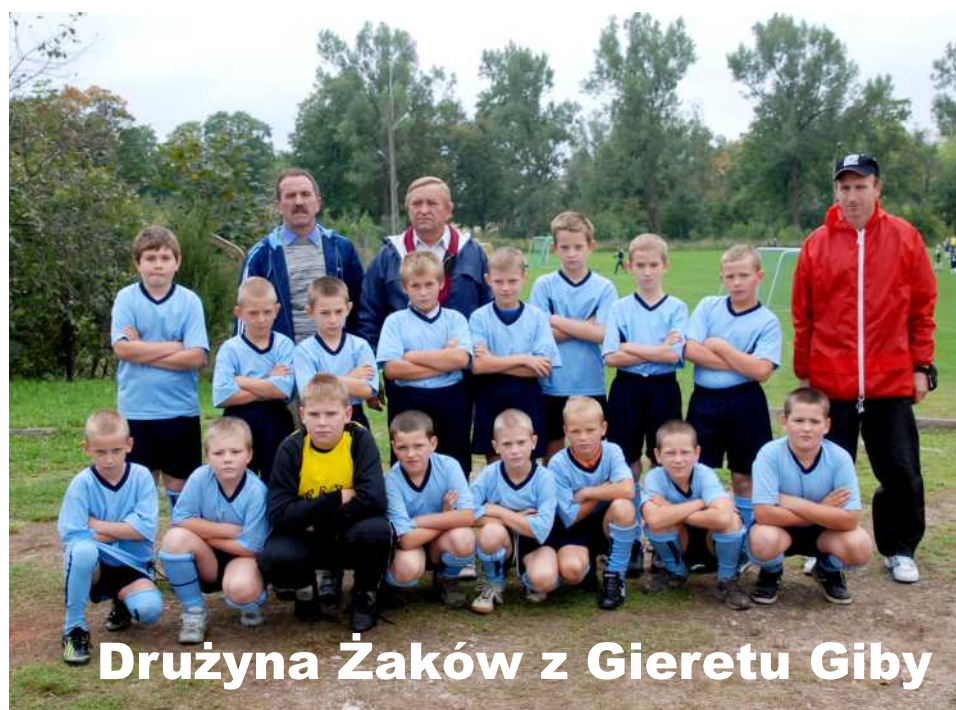
Drużyna Żaków z Gieretu Giby