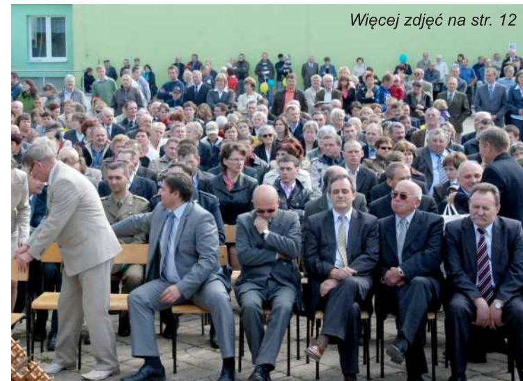
Więcej zdjęć na str. 12