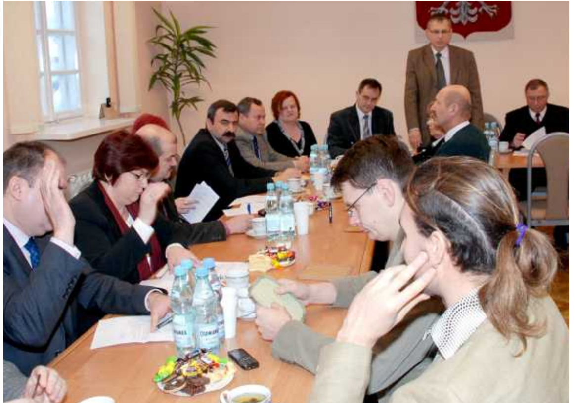
Listy od Czytelników

Ciąg dalszy oświadczeń w następnym numerze