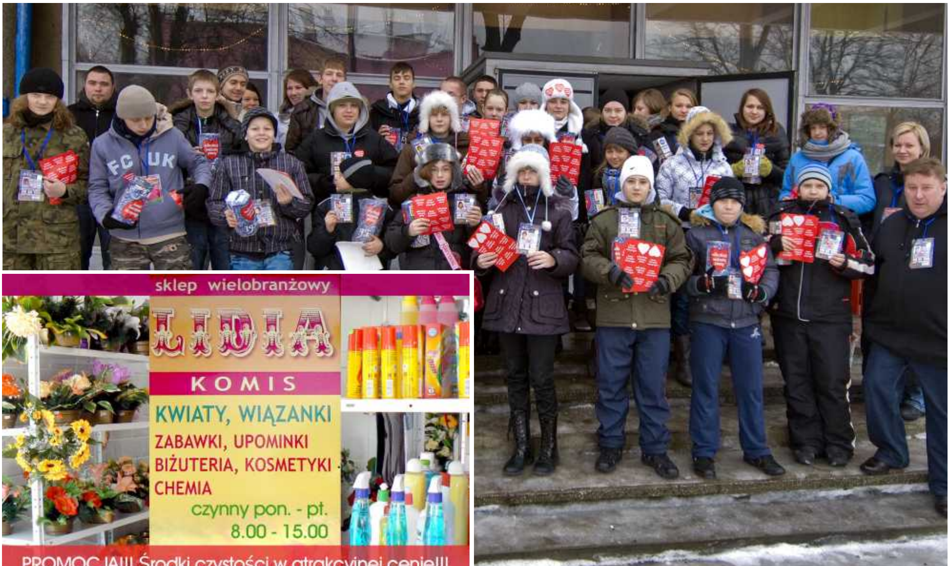
Na zdjęciu sejneńscy wolontariusze XIX finału Wielkiej Orkiestry Świątecznej Pomocy wraz z pracownikami Ośrodka Kultury