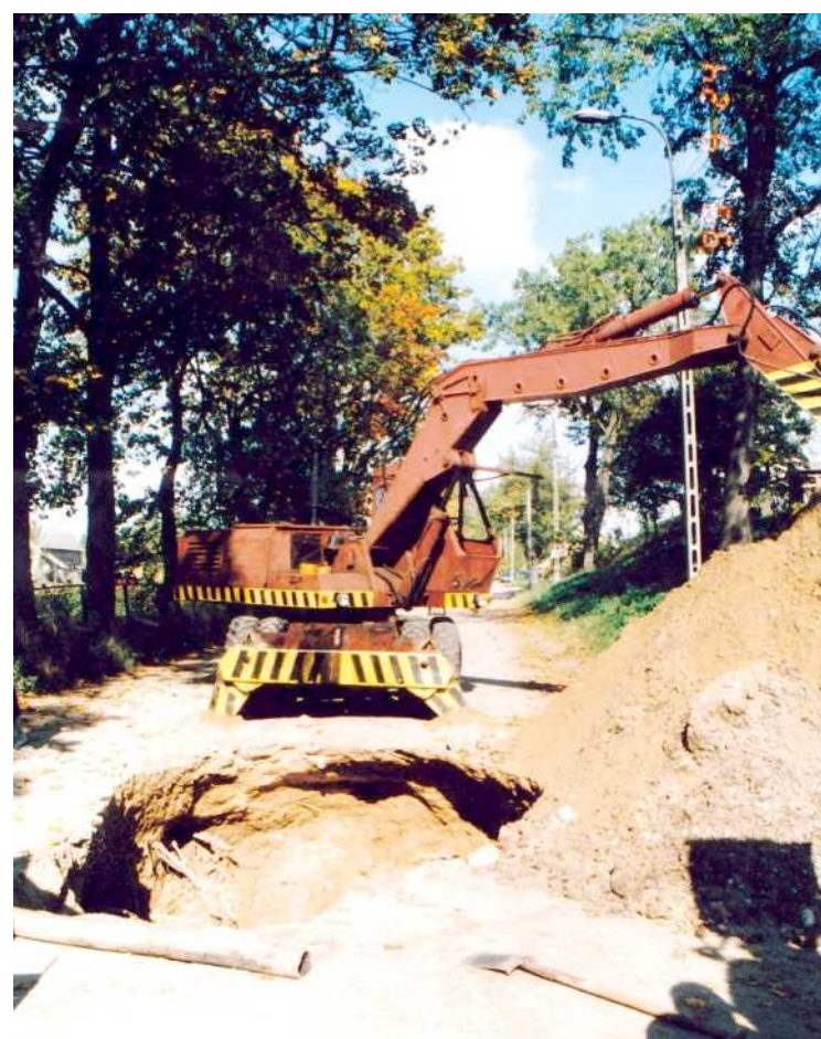
Fot powyżej: ul. Mickiewicza - pracują maszyny, choć przyjęto w dokumentach ręczny sposób wykopów, oczywiście droższy

Budżet Miasta Sejny w 1999 roku zamknął się kwotą 6 900 000,00 złotych, a więc skala zadłużenia z jaką zderzyliśmy się po wyborach w październiku 1998 roku była zaskakująca, tłumaczy dlaczego byliśmy najbardziej zadłużonym miastem do 20 tysięcy mieszkańców w Polsce, a z ówczesnych decydentów dzisiaj nikt nie uważa siebie za winnego.