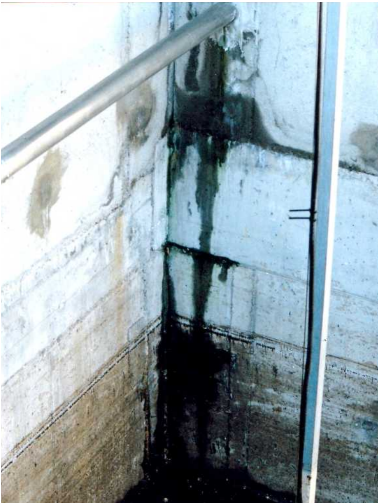
Źle wykonane żelbetonowe ściany komory biologicznego oczyszczania. Fot. powyżej: pęknięcie ściany wewnętrznej z przeciekami (czerwiec 1999 r.). Fot. poniżej: pęknięcie ściany z silnym wyciekami na zewnątrz (wrzesień 1999 r.).