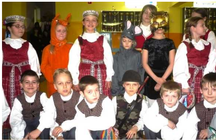
Sejneński zespół „Żiburėlis” wystąpił na suwalskich MarzeńTańcach 2011