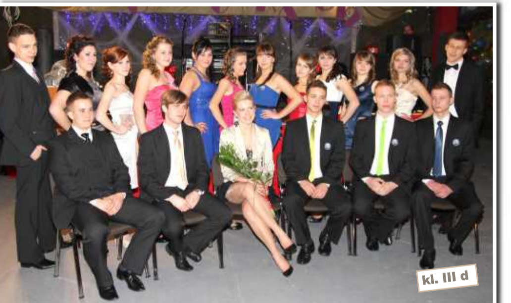
kl. III d