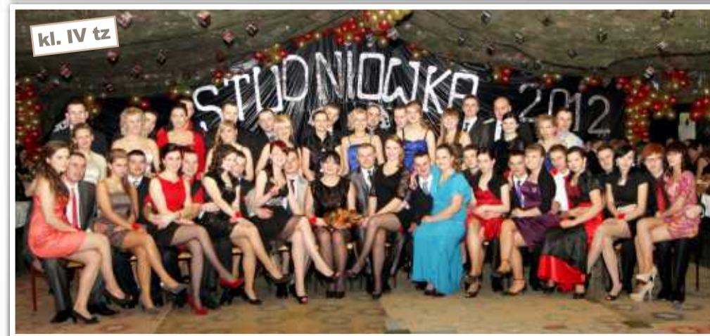
kl. IV tz