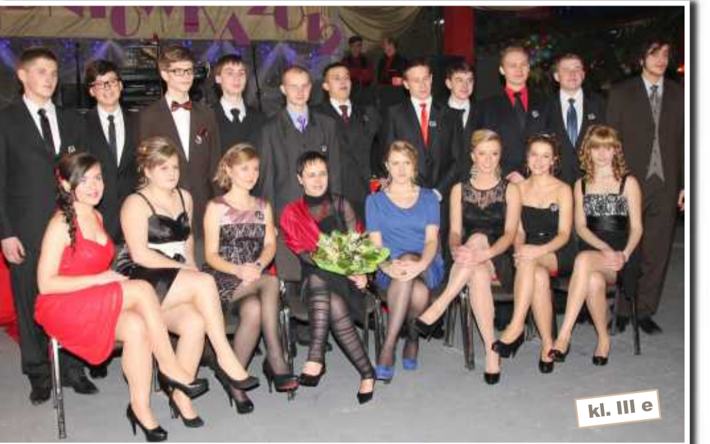
kl. III e