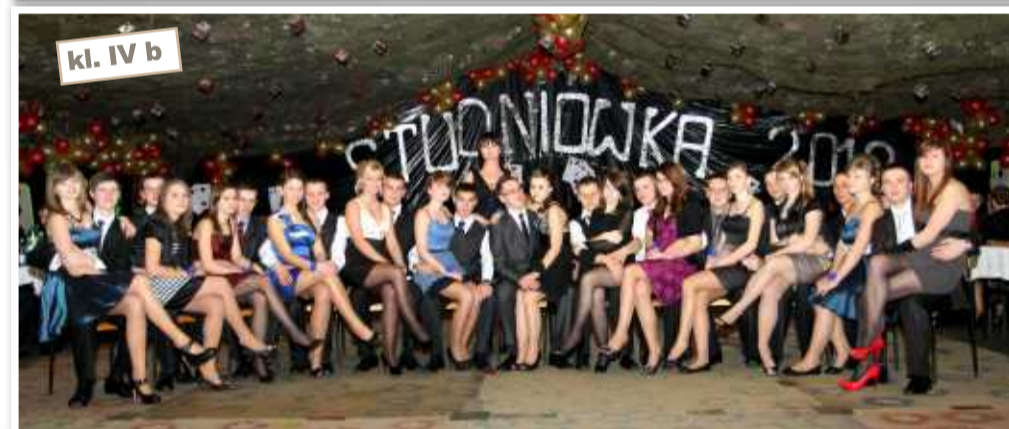
kl. IV b