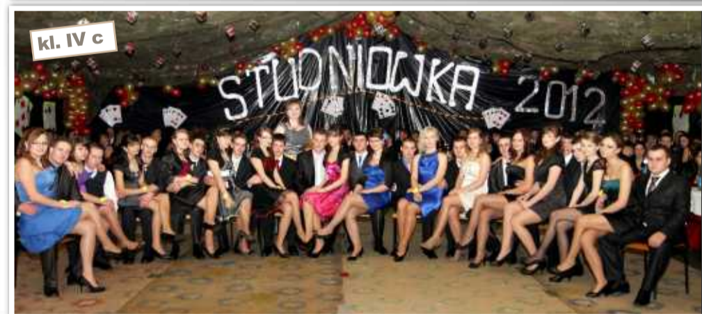
kl. IV c