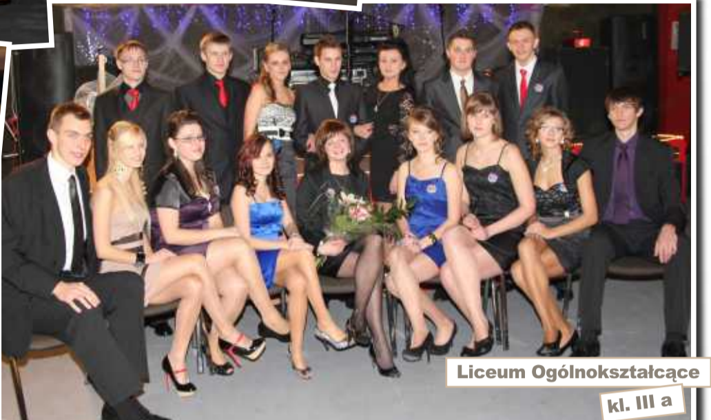
Liceum Ogólnokształcące kl. III a