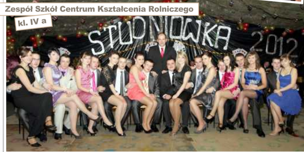
Zespół Szkół Centrum Kształcenia Rolniczego kl. IV a