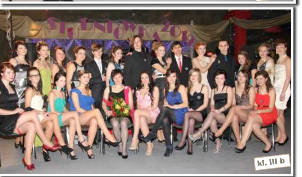
kl. III b