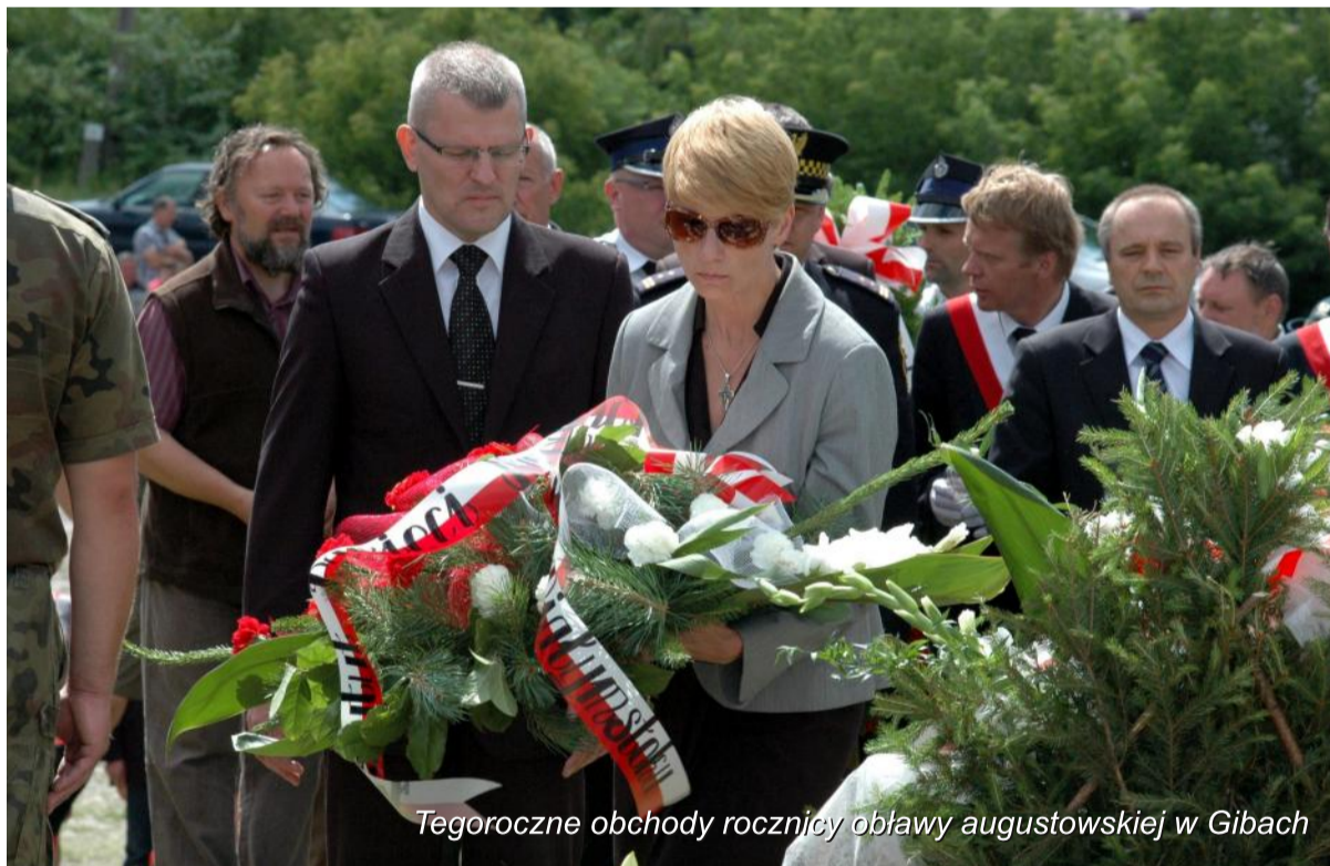
Tegoroczne obchody rocznicy obławy augustowskiej w Gibach