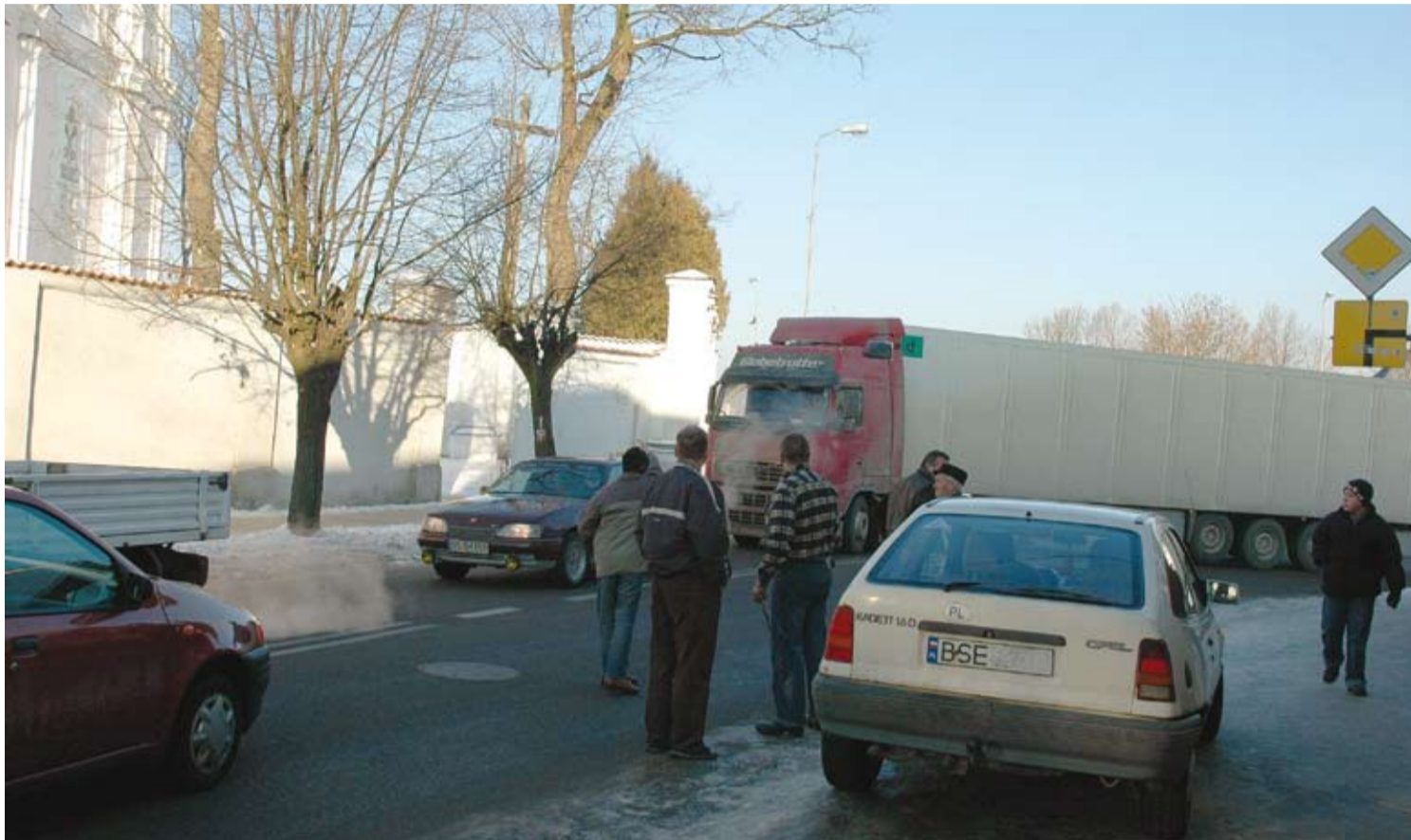
Drobna kolizja na skrzyżowaniu przed bazyliką.